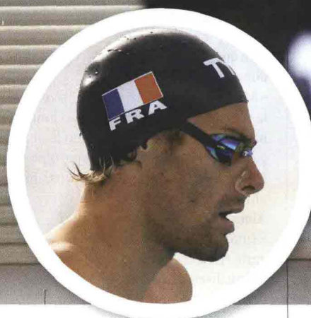
ESCLUSIVO CAMILLE LACOURT

Il francese Camille Lacourt, 27 anni, campione del mondo a Shanghai 2011 nei 100 metri dorso. In queste immagini è sul set dello spot Edison Energia girato a Milano.